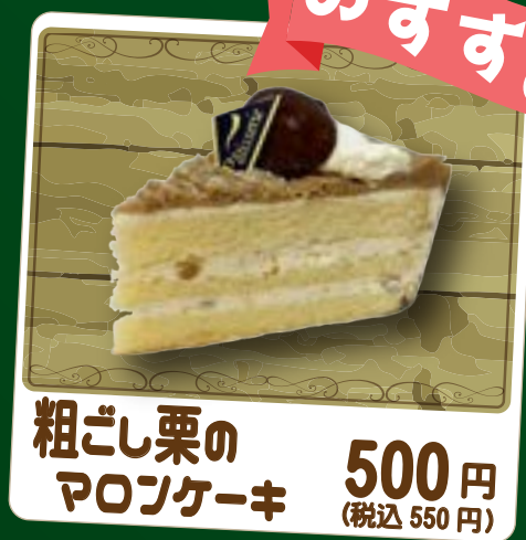
粗ごし栗の マロンケーキ