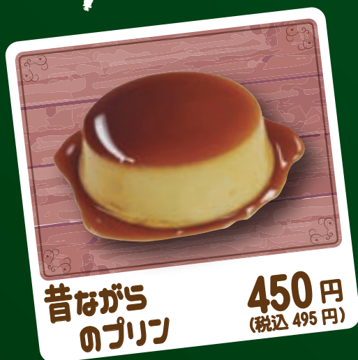
昔ながら のプリン