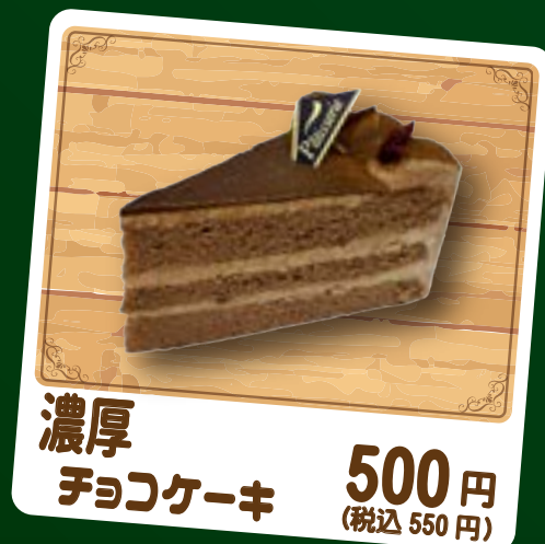
濃厚 チョコケーキ