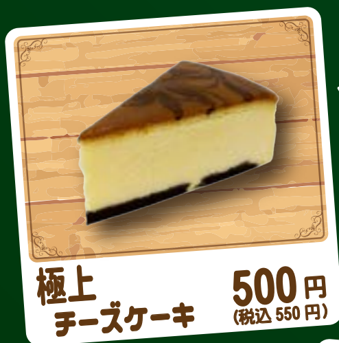
極上 チーズケーキ