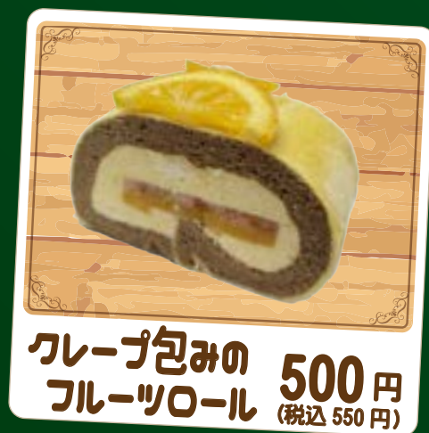
クレープ包みの フルーツロール