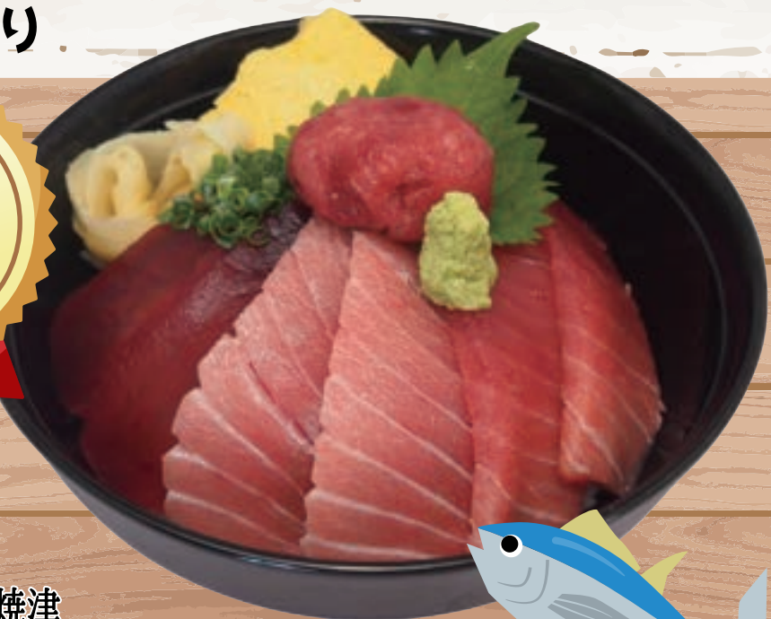
天然焼津 ミナミマグロ丼 1,680円 (税込 1,848 円)