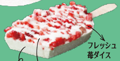
フレッシュ 苺ダイス ホワイトチョコレート いちごアイス