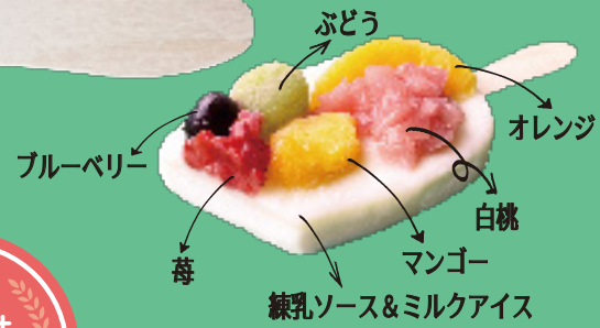
ぶどう ブルーベリー 苺 オレンジ 白桃 マンゴー 練乳ソース&ミルクアイス