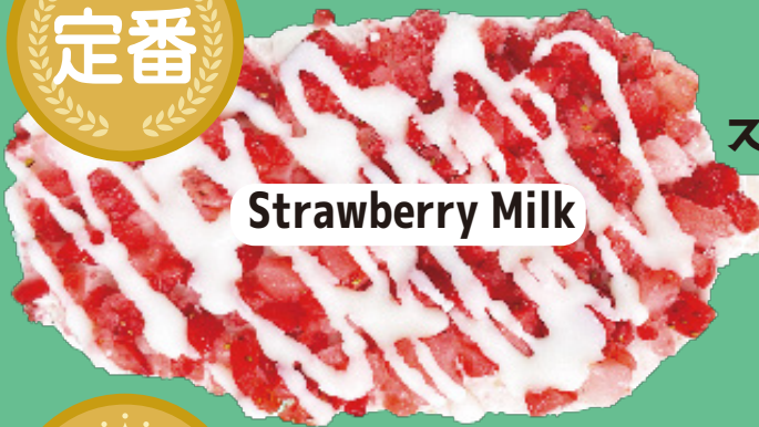
ストロベリーミルク