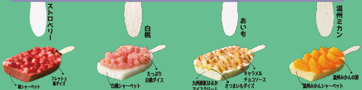
苺シャーベット フレッシュ 苺ダイス