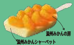
温州みかんの房 温州みかんシャーベット