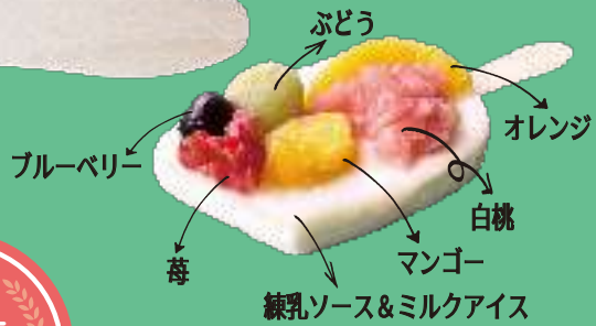
ぶどう ブルーベリー 苺 オレンジ 白桃 マンゴー 練乳ソース&ミルクアイス