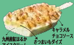
九州産紅はるか アイスクリーム