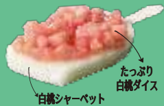
白桃シャーベット