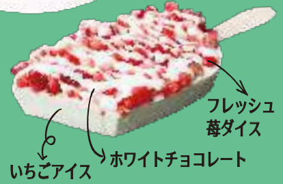
フレッシュ 莓ダイス いちごアイス ホワイトチョコレート